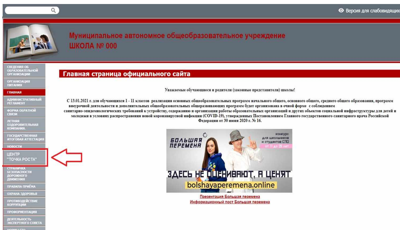
Рисунок 2. Пример размещения ссылки на раздел на сайте общеобразовательной организации

Пример размещения ссылки на раздел «Центр «Точка роста» в меню официального сайта общеобразовательной организации в сети «Интернет» приведен на рисунке 2.